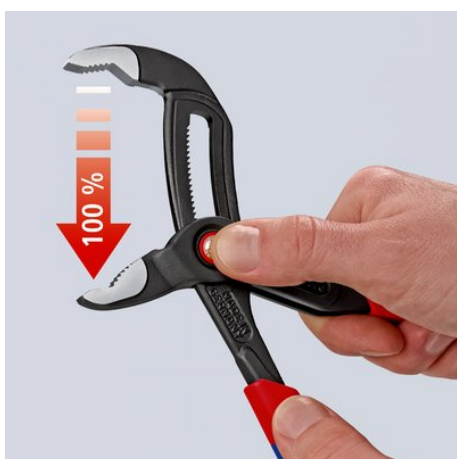
Premere il pulsante - aprire completamente la pinza